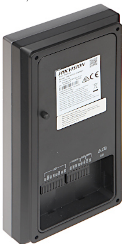
Widok wewnątrz (po otwarciu obudowy):