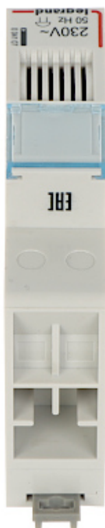
Widok z dołu: