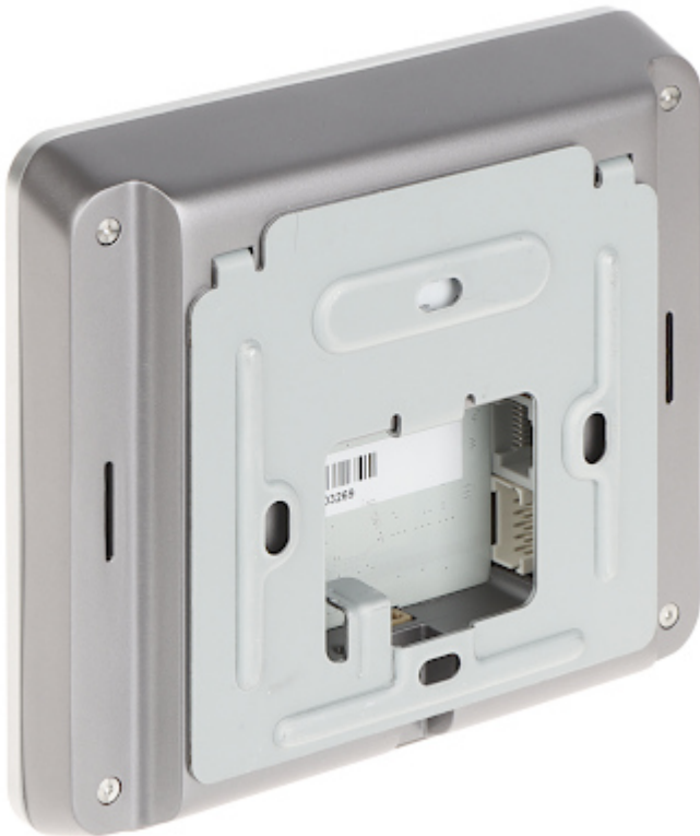
Widok z tyłu z zamocowanym stojakiem biurkowym: