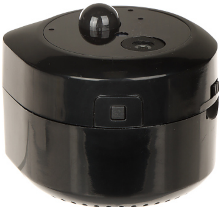
Złącze micro USB: