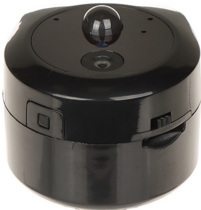
Gniazdo microSD oraz wyłącznik kamery: