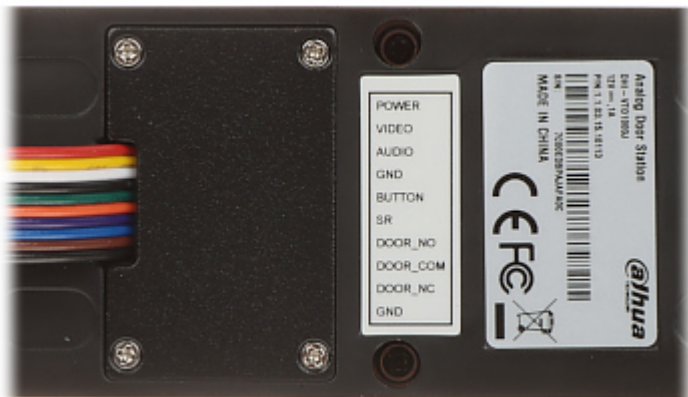
PANEL WEWNĘTRZNY: Widok od strony mocowania: