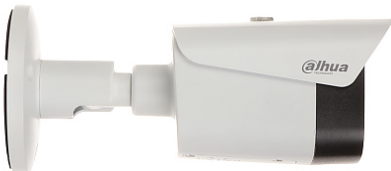
Widok od spodu: