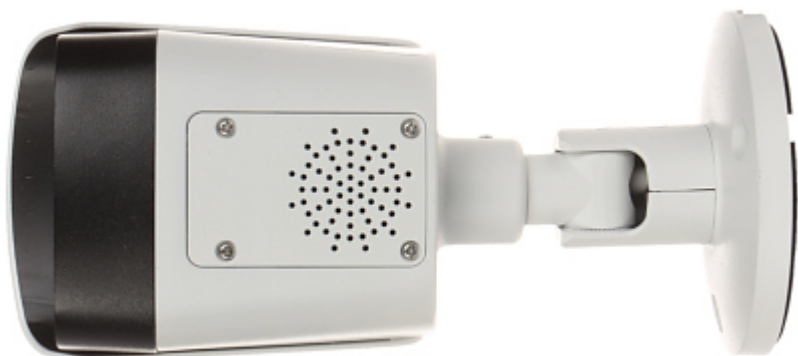
Gniazdo karty pamięci oraz przycisk "Reset":