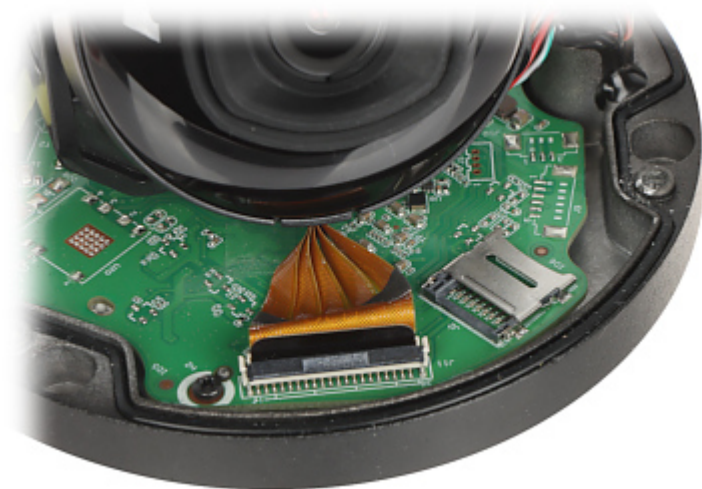
Widok od strony mocowania: