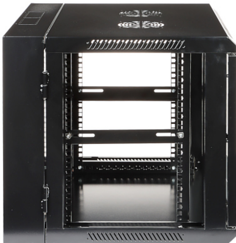
Otwory na wentylatory: