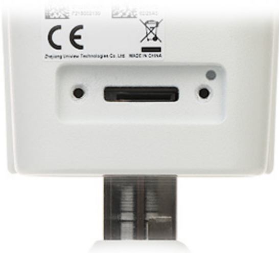
Widok od strony mocowania kamery: