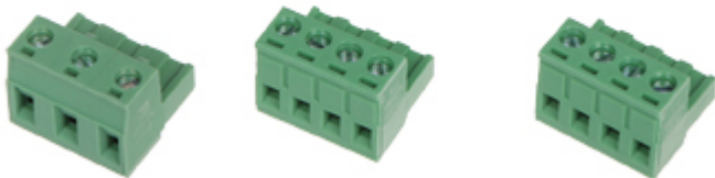
Widok od strony mocowania: