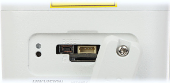
Widok od strony mocowania kamery: