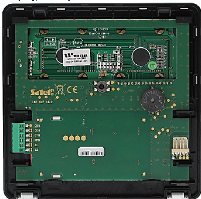
Widok od strony mocowania: