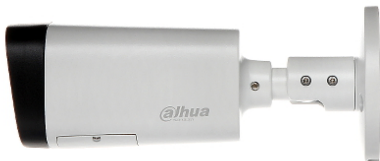
Widok od strony mocowania: