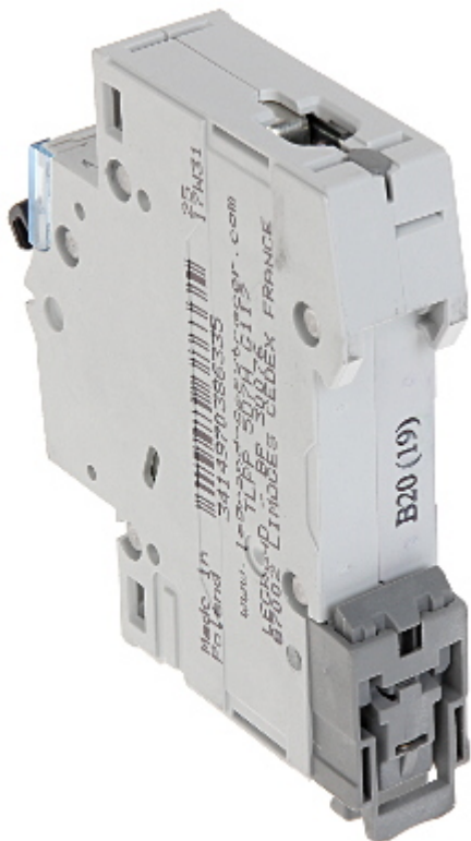
Widok z dołu