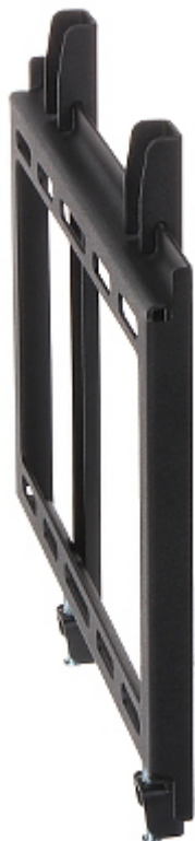
Widok od strony mocowania do ściany: