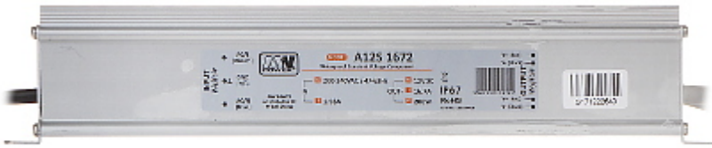
Widok od strony mocowania do ściany