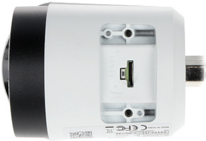
Widok od strony mocowania kamery