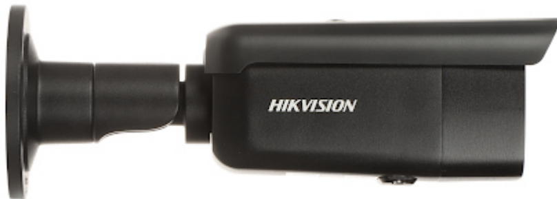
Gniazdo karty pamięci