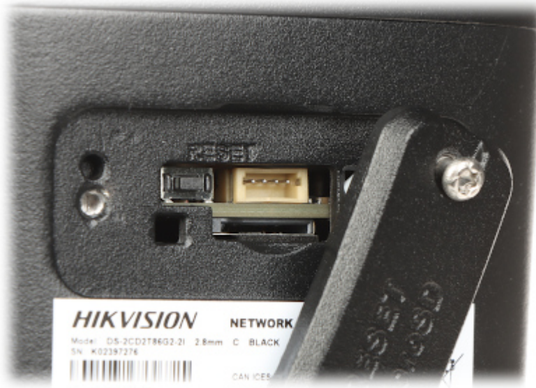
Widok od strony mocowania kamery