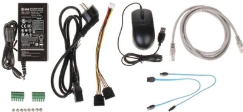
Przykładowe zrzuty interfejsu urządzenia