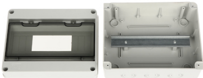
Widok od strony mocowania do ściany