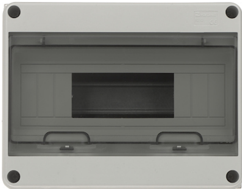
Widok wewnątrz obudowy