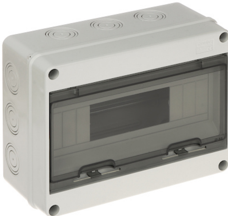
Rozdzielnica elektryczna natynkowa, hermetyczna 1-rzędowa 12-modułowa.

Urządzenie należy chronić przed kontaktem z płynami żrącymi oraz plamiącymi i lepкими.