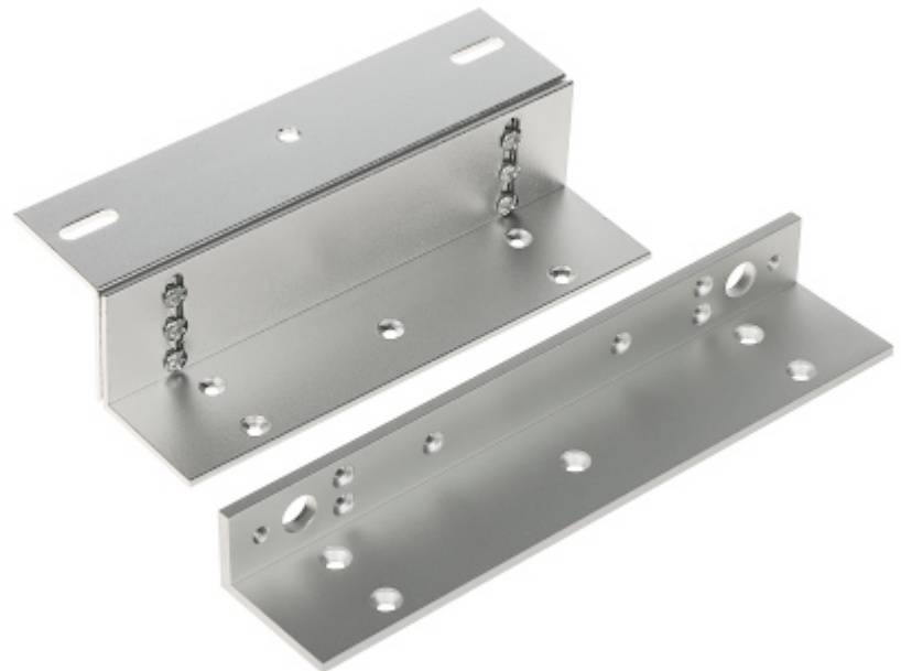
Zestaw zetownika i kątownika do zwory elektromagnetycznej JS-280W o udźwigu 280 kg.

Urządzenie należy chronić przed kontaktem z płynami żrącymi oraz plamiącymi i lepкими.