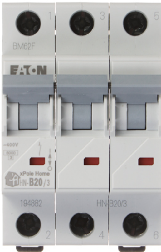
Widok z przodu