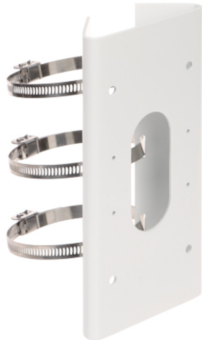
Uchwyt przeznaczony do zamocowania kamery na słupie.

Urządzenie należy chronić przed kontaktem z płynami żrącymi oraz plamiącymi i lepкими.