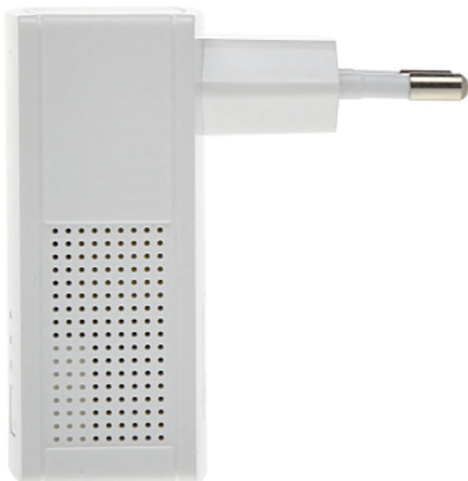
Poglądowy sposób działania urządzenia: